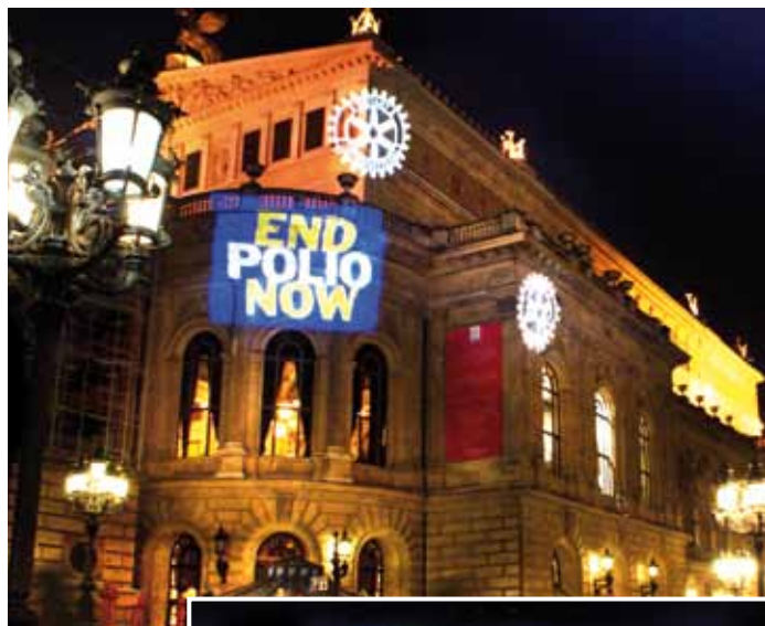
Zwei Opern- standen 2009 im Mittelpunkt spektakulärer PR-Aktionen: die Alte Oper in Frankfurt/Main (oben) und die im australischen Sydney

2. Es ist erreichbar: Wir haben Wege und mit dem Polio-Impfstoff das nötige Mittel, um alle Kinder vor der Krankheit zu schützen.