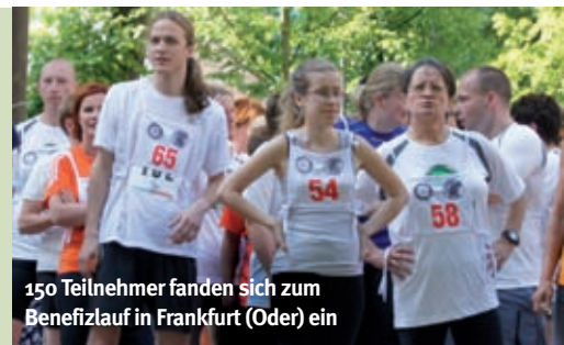
150 Teilnehmer fanden sich zum Benefizlauf in Frankfurt (Oder) ein

als 150 Läufer nicht nur ihren Körpern etwas Gutes: Durch ihre Spenden in Form der Startgelder (Erwachsene sowie Familien 5 Euro, Kinder 3 Euro) unterstützen sie den Kampf gegen die Kinderlähmung. Große Freude herrschte insbesondere bei den Siegern, die sich jeweils über ein gestiftetes Navigationsgerät der Firma Navigon freuen durften, sondern auch bei den Empfängern weiterer Gewinne, die von den Firmen MarsMedia und Electronic Partner (EP) aus Frankfurt (Oder) verlost wurden. Neben Grillstand und Getränkestation war auch für ein buntes Kinderprogramm mit Hüpfburg und Glücksrad gesorgt.