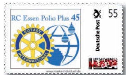
Dies ist die Marke, die der RC Essen in Umlauf gebracht hat. Vor Ausweitung der Aktion sind noch einige Fragen zu klären

Die Marken werden im 20-er Block zu 20 Euro abgegeben. Der Preis setzt sich zusammen aus 11 Euro Portowert, 3 Euro Beteiligung Druck-